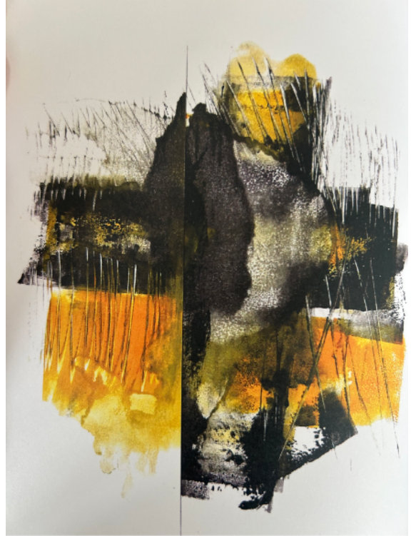
Peinture ©2025 Maria Desmée

Transhumance des âmes vers ce lieu très lointain que cherchait le poète comme le marin cherche l'entrée du passage. Stagiaire éphémère qu'effeuille la question avant de trouver le port l'homme alignait ses mots comme on aligne les morts et pour ne pas blasphémer il s'excusa de l'espoir que donne la parole. Il faut longtemps dériver pour accepter l'oracle sans révoquer les cieux.